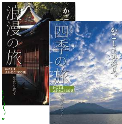
浪漫の旅・四季の旅 各税込 680円

県内外の方々から寄せられた選りすぐりの観光地を、5つのテーマで「かごしまよかところ100選」として選定しました。