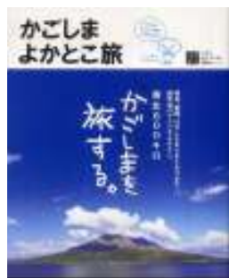
かごしまよかところ旅 税込 980円

県内外の方々から寄せられた選りすぐりの観光地を、5つのテーマで「かごしまよかところ100選」として選定しました。