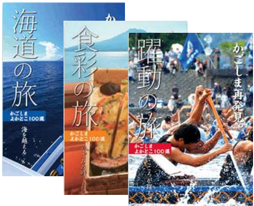
海道の旅・食彩の旅・躍動の旅 各税込 980円